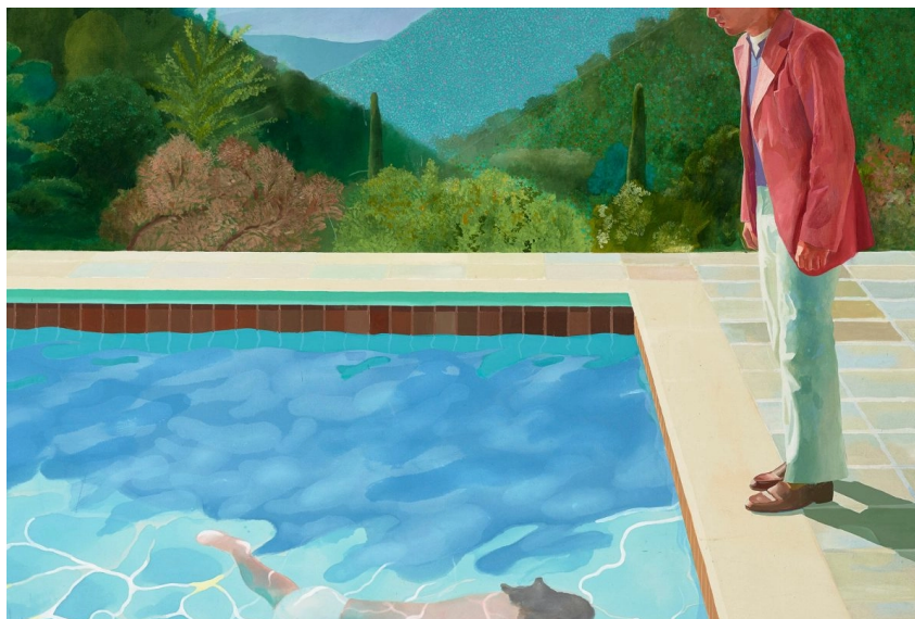
FIGURE 1 – Portrait of an Artist - David Hockney

L'image choisie est un tableau de David Hockney intitulé Portrait of an Artist .